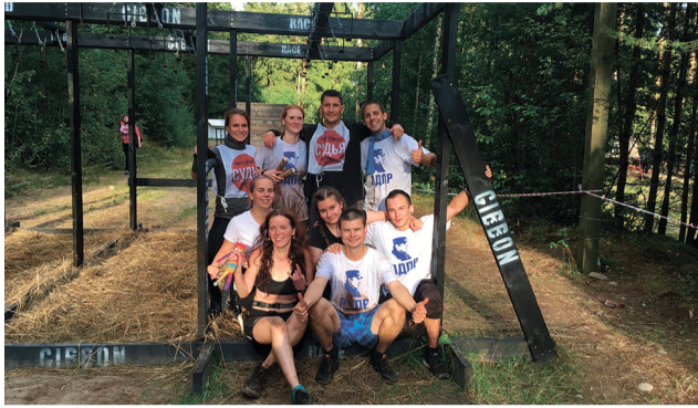
В начале сентября состоялась двухдневная гонка Nord Race с препятствиями