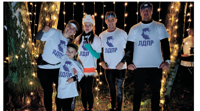
Активисты партии ЛДПР приняли участие в забеге трезвости