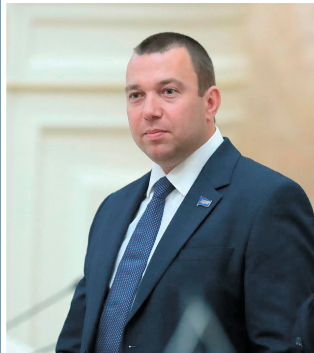
ПАВЕЛ ИТКИН, лидер фракции ЛДПР в Законодательном Собрании Санкт-Петербурга

Сентябрь в этом году был насыщенным: прошли рабочие совещания по подготовке городского бюджета, состоялись первые после пандемии заседания осенней сессии, заработали депутатские комиссии.