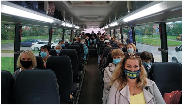
При поддержке партии ЛДПР была организована обзорная экскурсия в город Выборг и парк Монрепо для МО ВОС Купчино