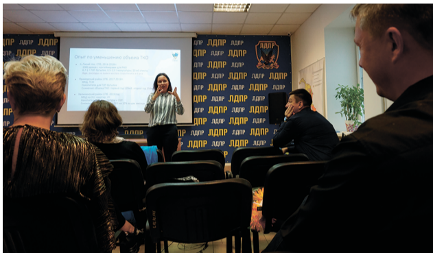
В штабе состоялась экологическая лекция от проекта «Раздельный сбор»