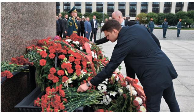
Партия ЛДПР почтила память погибших в день начала блокады Ленинграда